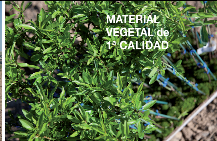
MATERIAL VEGETAL de 1ª CALIDAD