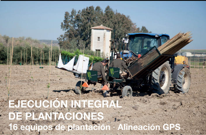
EJECUCIÓN INTEGRAL DE PLANTACIONES 16 equipos de plantación · Alineación GPS