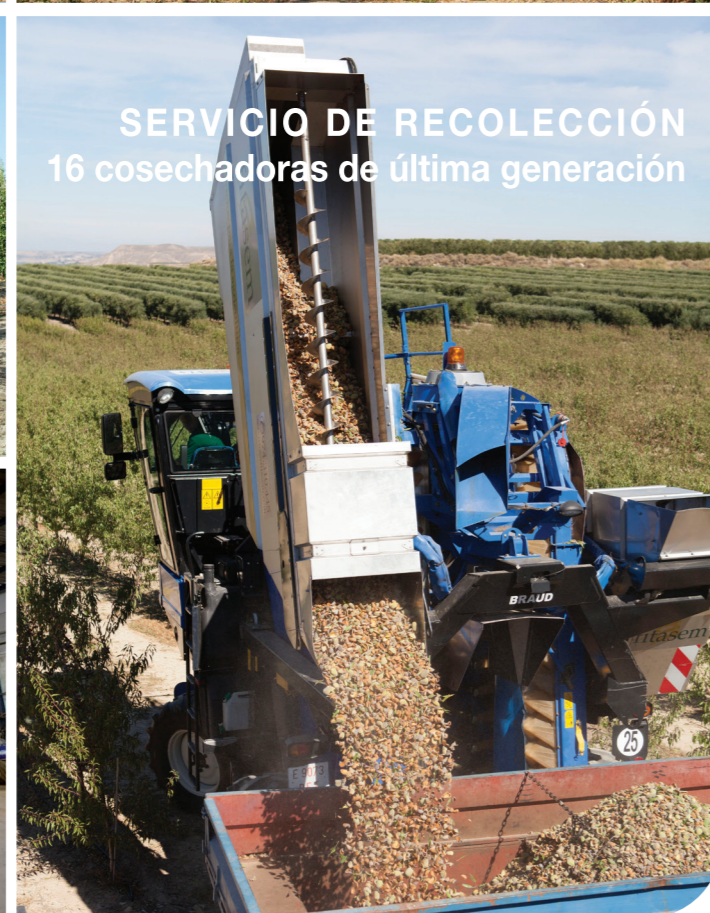
SERVICIO DE RECOLECCIÓN 16 cosechadoras de última generación