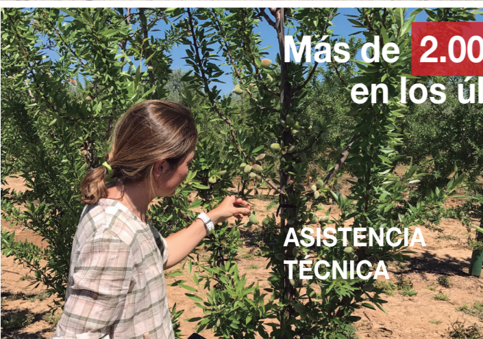
Más de 2.000 ha plantadas en los últimos años